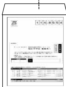
市販の封筒に貼って送付

原則1月31日(日)までにご郵送ください。なお、当日出願、直前出願の方は試験当日お持ち下さい。